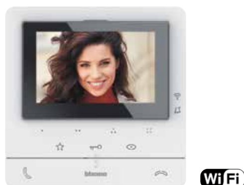
Class 100 X16E